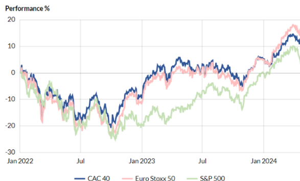
Progression des principaux indices depuis janvier 2022