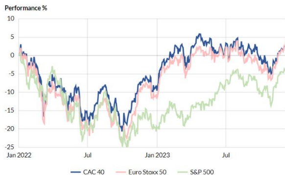
Progression des principaux indices depuis janvier 2022