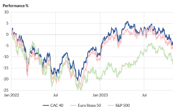
Progression des principaux indices depuis janvier 2022