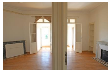
Appartement T3 71m 2 Saint-Seurin – Croix Blanche Petite copropriété 400 000 € FAI