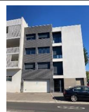
Appartement avenue Arès – Caudéran 2 chambres – 1 er étage avec loggia et garage 370 000 € FAI