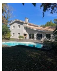
Maison familiale au centre de Pessac – 240 m 2 6 chambres - jardin avec piscine 999 000 € FAI