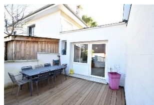
Maison T2 de 42 m 2 avec terrasse à Bordeaux Caudéran 239 200€ FAI

160m 2 environ sur une jolie parcelle paysagée Bien rare.