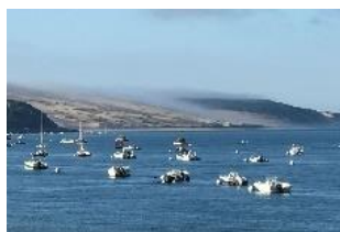
Très belle villa au Moulleau Prix : nous consulter

160m 2 environ sur une jolie parcelle paysagée Bien rare.