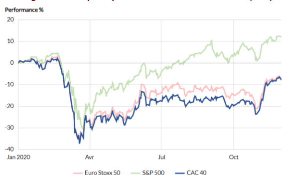
Progression des principaux indices boursiers en 2020 (YTD)